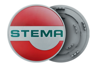
Radkappen (2 Stück)