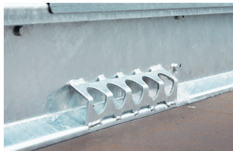
massives Verzurrprofil für mehr Sicherheit