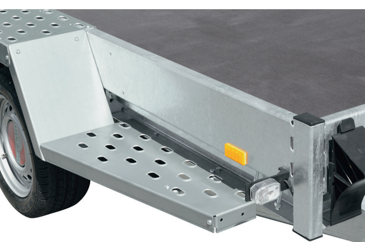
Trittläche mit Lochprofil, für vorn und hinten (Zubehör)

Bilder sind Musterabbildungen und können Sonderausstattung enthalten.