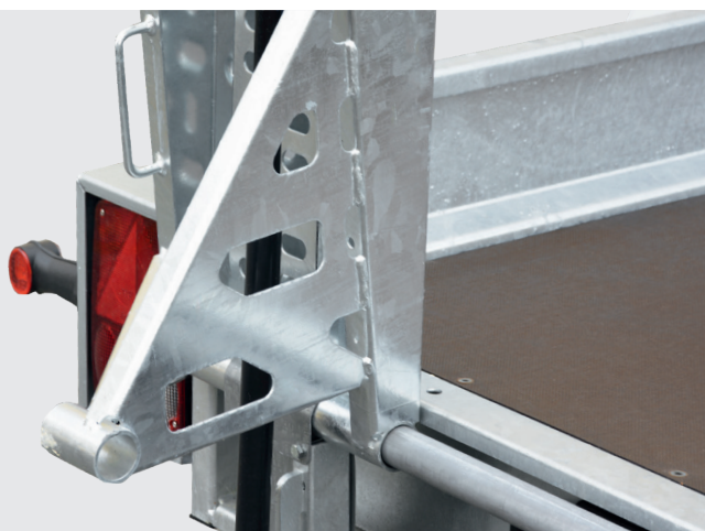
Stahlrampen mit integrierter Abstützung