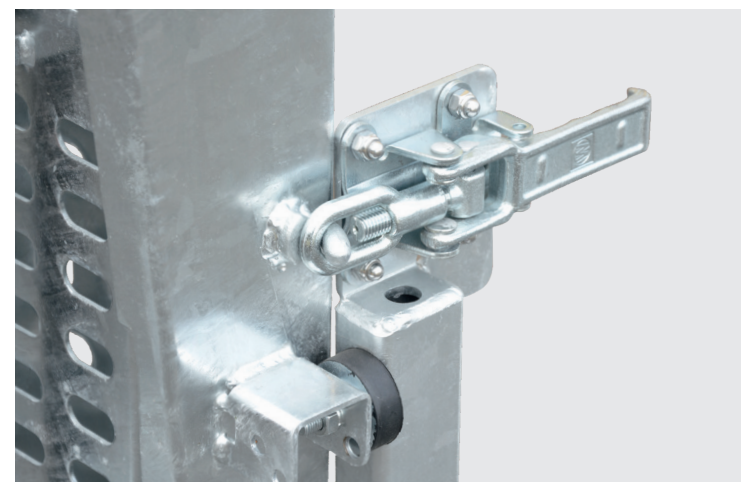
leicht bedienbare Rampenverriegelung