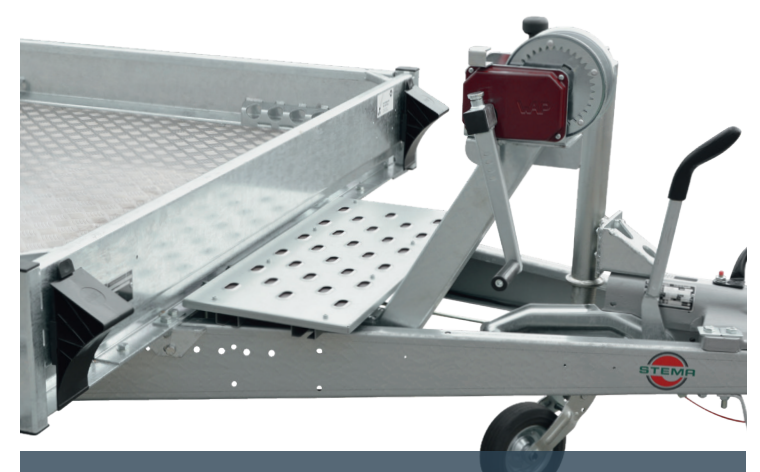
Baggerschaufelablage & Windenstand mit Seil (Zubehör)